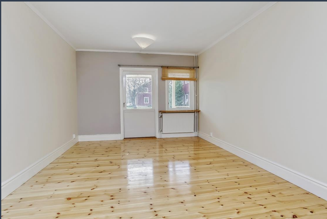
Sovrum mot altan och söder