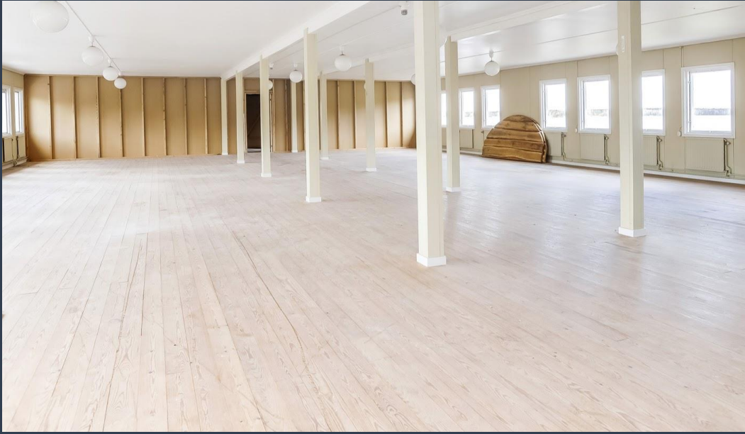
Förråd i övervåningen