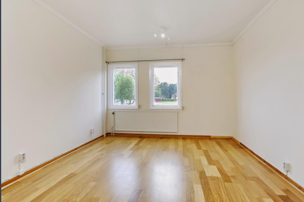
Sovrum mot norr och strand